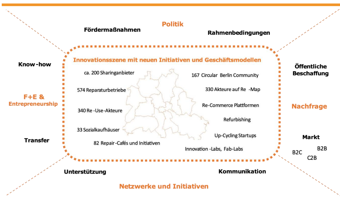
Abbildung 2: Innovationsökosystem für eine Kreislaufwirtschaft der nächsten Generation in Berlin

Mittlerweile ist in Berlin ein Innovationsökosystem für zirkuläres Wirtschaften entstanden, das den Fokus auf neue Produktnutzungssysteme richtet (siehe Abb. 2).